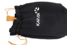
Sac de rangement

Pas dans la boîte : cosses, drosse, anti torsion,... et voile !