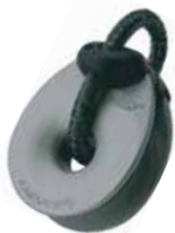
Gamme de poulies KBO