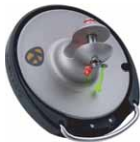
KF1 et KF2 option roue crantée large