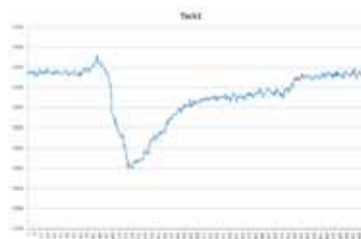
Graphique représentant la charge dans l'étai en fonction du temps lors d'un virement