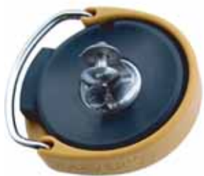
Nouveaux KF0.75, KF1 & KF2