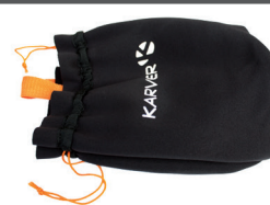
Sac de rangement