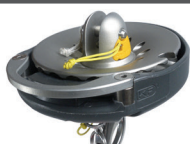
Emmagasineur avec mousqueton