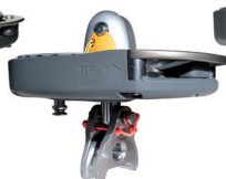
Réa friction 3:1 HR