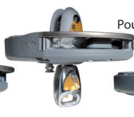
Poulie de mouflage